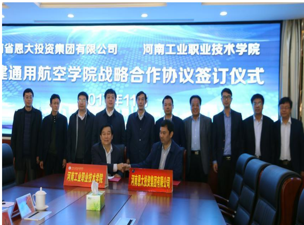
图 4-2 校企签订战略合作协议

学院主动适应军工和地方经济社会发展的需要，有针对性地调整和优化专业设置，建立了与河南军工行业和区域经济社会发展相适应的专业发展规划；深化人才培养模式改革，根据行业、企业职业岗位任职要求和职业资格标准，改革课程体系和教学内容，与成员单位重点实施“订单培养”“现代学徒制”等人才培养模式改革；围绕企业需要开展职业岗位和专业技能培训，合作开展科技攻关，解决企业的技术难题；鼓励教师联系和服务军工企业，选派教师到企业挂职锻炼和顶岗实践，提高专业教师的实践能力；聘请行业企业的专业人才和能工巧匠担任兼职教师；与企业合作组建校中厂等校内生产性实训基地。建立适应企业生产和工学结合需要的灵活、弹性教学组织模式和教学管理制度。采取各种措施保障军工行业人才培养要求和需求，不断提高技能人才培养的水平和质量，提升社会服务能力。同时，不断探索办学模式的突破和创新，调动企业办学积极性，充分发挥企业办学活力。与河南恩大投资集团有限公司共同探索建设具有混合所有制特征的航空工程学院，实行理事会领导下的院长负责制，服务和促进南阳及河南通用航空产业发展。