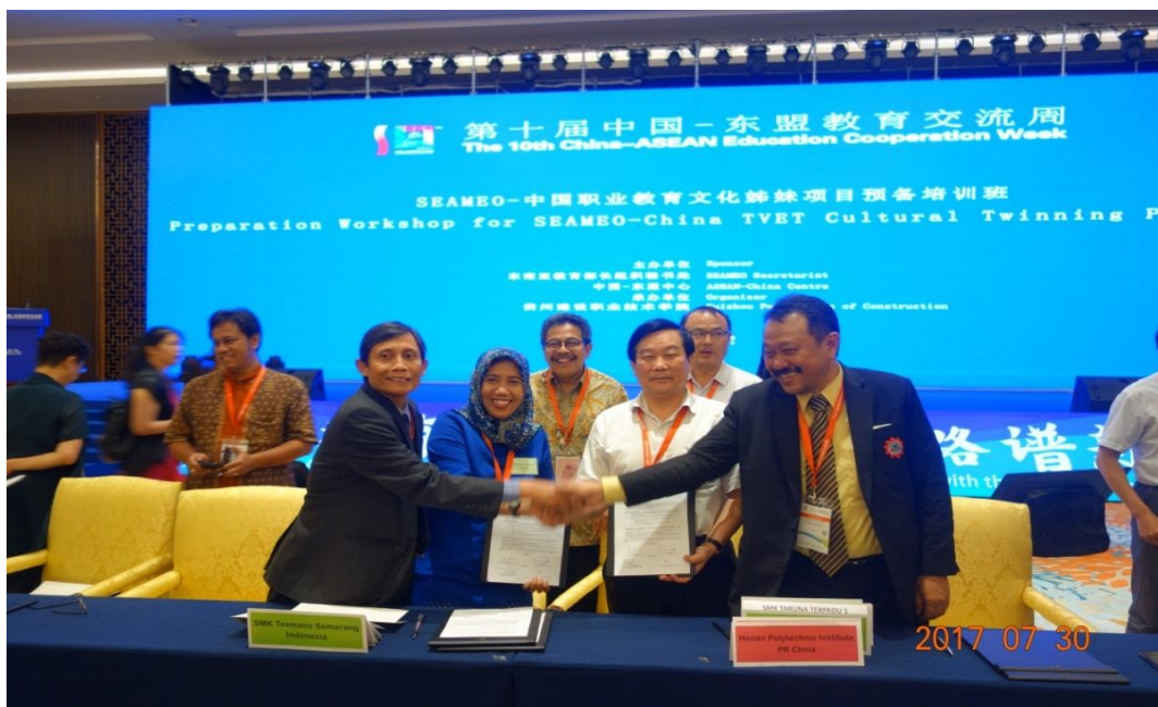
图 7-2 学院加入中国-东盟职教合作联盟、中国职业教育对外合作联盟