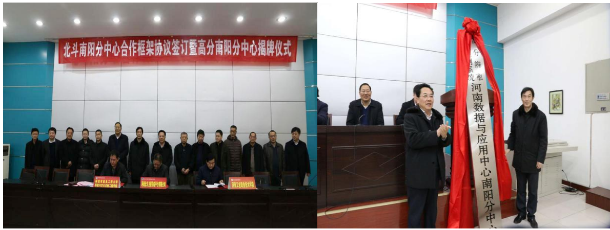
图 6-1 校企共建北斗南阳分中心和空间信息技术应用协同创新中心

为进一步优化科学研究和技术服务环境，学院 2016、2017 年建设了 2 个南阳市重点实验室（南阳市 PCB 制版重点实验室、南阳市广告创意重点实验室）和 2 个南阳市工程技术研究中心（南阳市石化防爆设备工程技术研究中心、南阳市供应链物流工程技术研究中心），平台获南阳市财政资助建设费 15 万元。