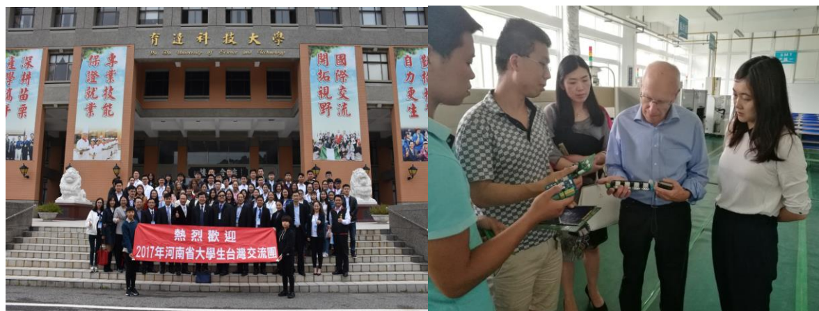
图 7-1 学校邀请德国职教专家到校开展专项培训并指导专业建设

学院通过“引进来、走出去”，积极推进教育国际化进程。聘请2名外籍教师的到校任教。邀请3名德国职教专家到校开展“德国职业教育教学法”、“汽车电控系统原理与维修”、“工业机器人应用与开发”等专项培训并指导专业建设，如图7-1所示。1名青年教师被国家留学基金委录取并派出到德国进行为期3个月的专业学习。组织8名学生和1名老师参加台湾冬令营活动。1名学生赴加拿大院校继续深造。学院与俄罗斯、加拿大、德国、西班牙、泰国、澳大利亚等国家和地区的高等院校、科研机构等开展各类国际交流合作。我院引智工作管理规范、制度健全，被南阳市公安局出入境管理处授予“2016年度出入境免备案单位”和“2016年度南阳市外国人管理服务先进单位”的荣誉称号。通过国际交流与合作工作的开展，开拓了师生的国际视野，加快了学院国际化战略进程。